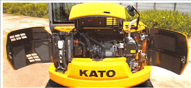
▲外装フルオープンと集中レイアウト。メンテナンス効率大幅改善