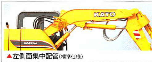
▲左側面集中配管(標準仕様)