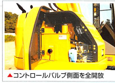
▲コントロールバルブ側面を全開放