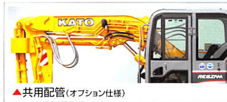
▲共用配管(オプション仕様)