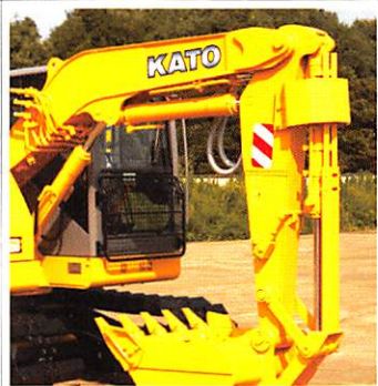
▲シリンダ損傷防止ガード(標準仕様)