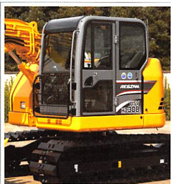
▲新設計低車高キャブ キャブフロントハーフガード(オプション仕様)