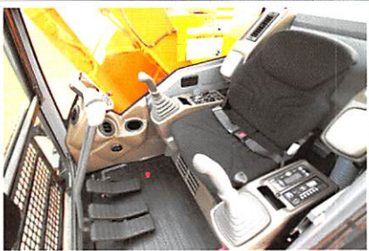
▲安全・快適設計の新型キャブ内